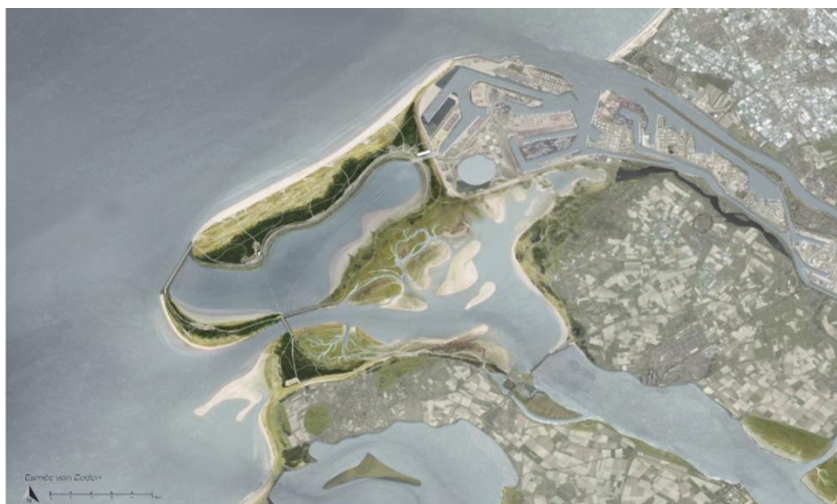
Masterplan Delta 21 door Esmee van Eeden

Veel belangstelling ging uit naar de mogelijkheden van Delta21.