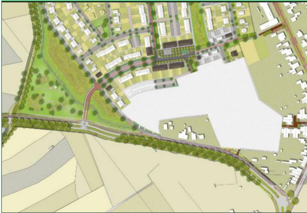
Woningbouw op de Bulders