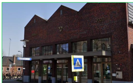
Dorpshuis De Schammert (Leende)