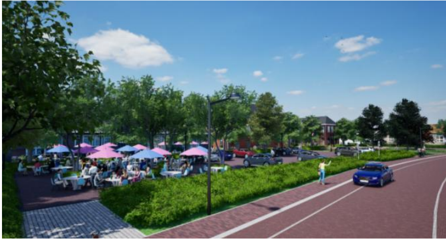
Impressie Ontwikkeling gemeentehuisplein en -tuin