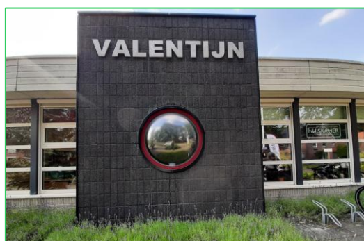
Dorpshuis Valentijn (Sterksel)