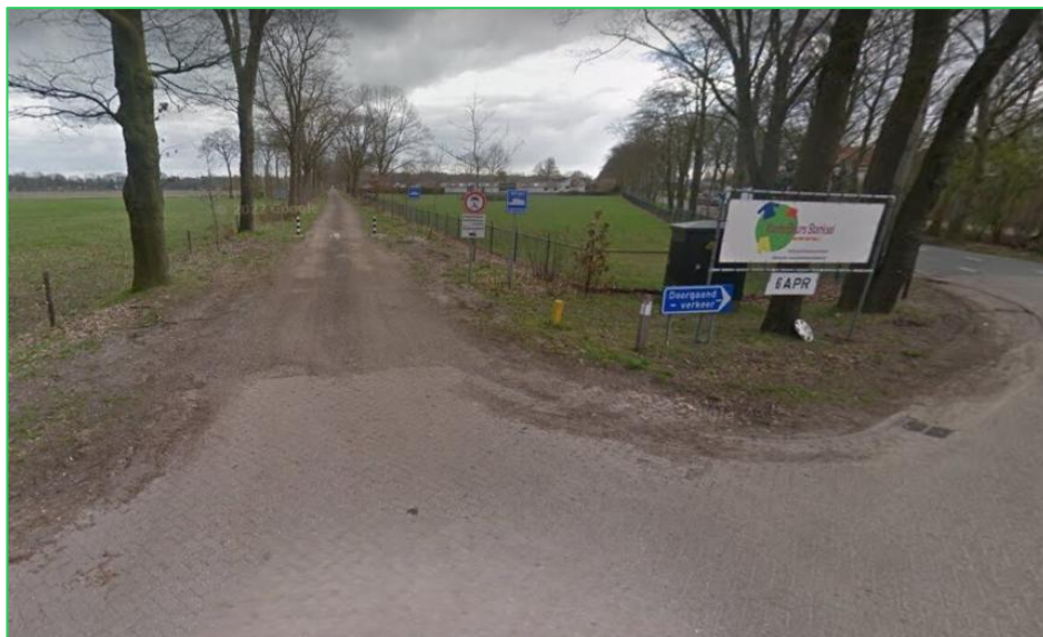
Onverharde Kloosterlaan in Sterksel